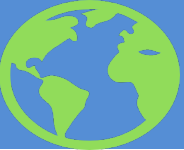
Схема направления граждан РК на лечение за рубеж за счет бюджетных средств